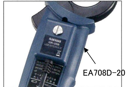
背面接続のイメージ