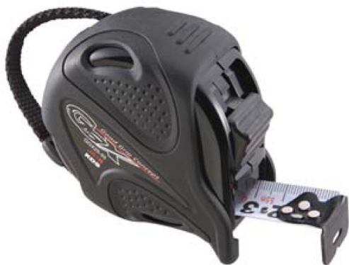
ナイロンコーティング