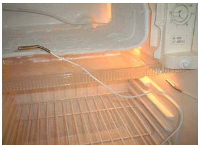
(冷蔵庫内 センサー写真)