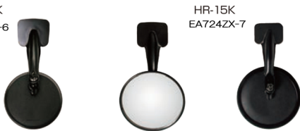
外径サイズ：丸147φ 曲率半径：300R