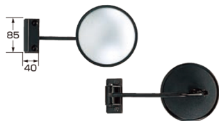
外径サイズ：丸147φ 曲率半径：120R