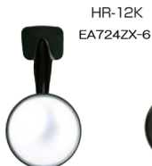
外径サイズ：丸115φ 曲率半径：100R