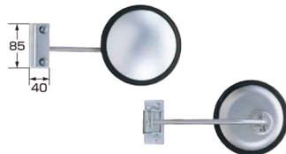
外径サイズ：丸147φ 曲率半径：120R