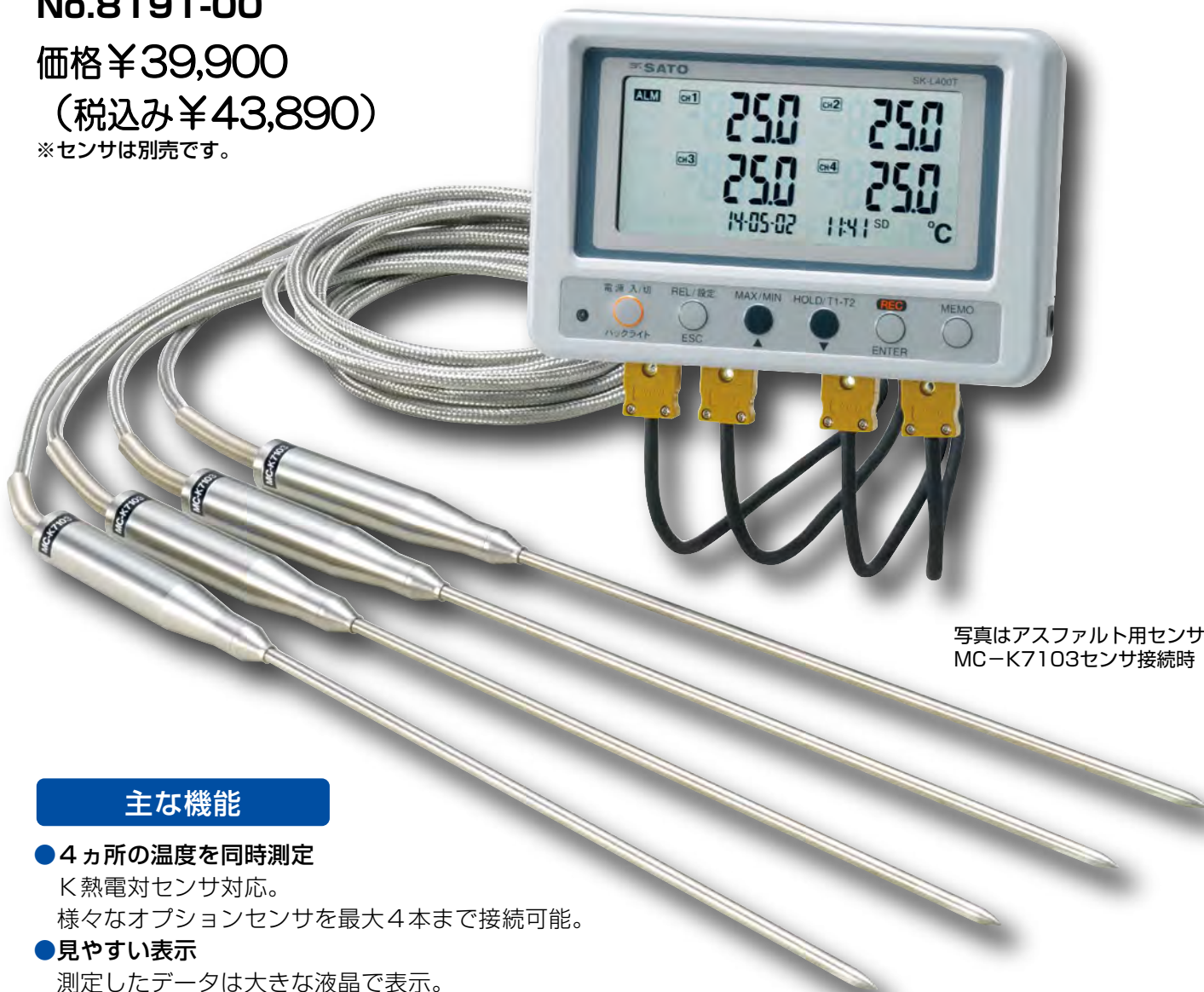
写真はアスファルト用センサ MC-K7103センサ接続時