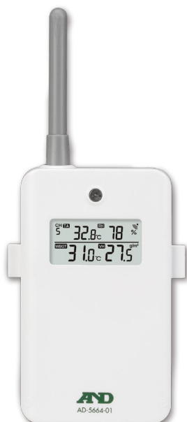
子機 (外部センサー・送信機)