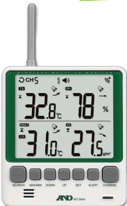
親機 (表示器・受信機)