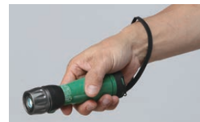
落下防止用ストラップ付