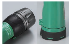
滑りにくいゴム製グリップと プロテクターゴム付(後部)