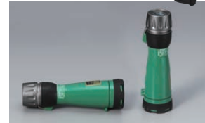
横置き・縦置き可能