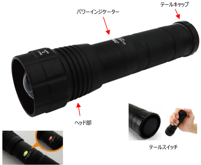
電池残量が分かるパワーインジケーター付 (残量が15%以下になると緑→赤に点灯します)