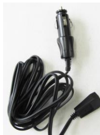
シガーライターDCアダプター