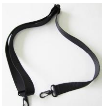
ショルダーベルト