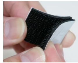
デュアルロックファスナー