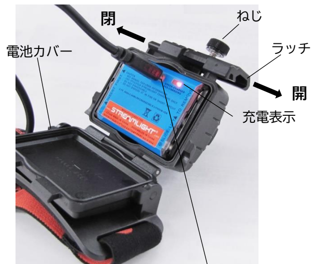
充電ポート(Micro USB typeB)