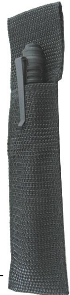
ライトホルスター