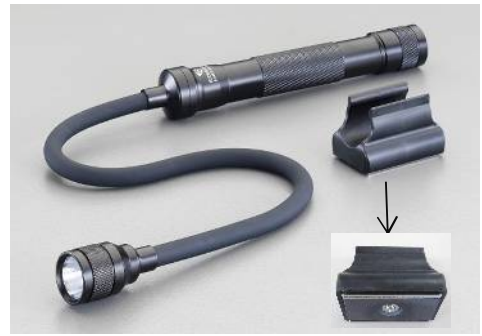
(マグネット壁面取付マウント) 裏面にマグネット付