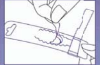
2 めくり上げて開封