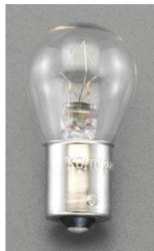
口金(差込形):ピン式(並ピン)