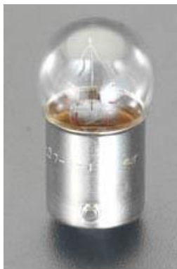
口金(差込形):ピン式(並ピン)