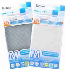
画像はMサイズを現していますが、現物はLサイズです。

TEIJINの超極細繊維「マイクロスター®」 を使用した高性能クリーニングクロス