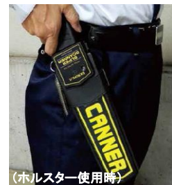
(ホルスター使用時)