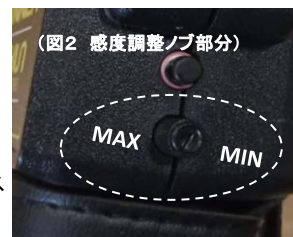
(図2 感度調整ノブ部分)