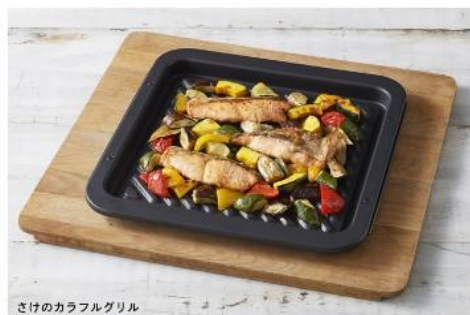
さけのカラフルグリル

身近な食材で手間を少なく、グリル皿ごとテーブルに出せるメニューです。 肉や魚などのタンパク質と野菜が一緒にバランスのよいメニューもあります。