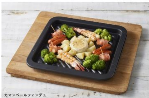
カマンベールフォンデュ