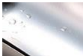
フッ素コートなし