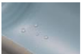
フッ素コートあり