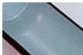
フッ素コートあり

お茶を入れて3ヶ月使用。ステンレスボトルの内面は洗剤でスポンジ洗いすると、ほとんど汚れが気になりません。