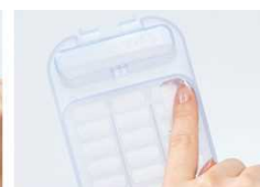
内側の角が丸く糸くずを取りやすい