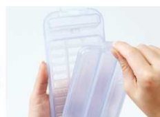
ツメをつかんで開けやすい