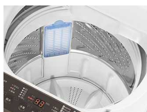
槽内は明るく清潔感のあるホワイト色 (写真はNA-F70PB12)

洗濯槽クリーナー(別売)を使い、槽の汚れを落とします。 (所要時間:約11時間)