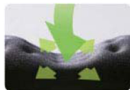
低反発ポリウレタン採用

手首の疲労を軽減する低反発ポリウレタン採用のリストレスト(ダブルタイプ)です。手首に優しくフィットし、動きに応じて荷重を吸収・分散します。新開発の凹凸(ディンプル)加工により、従来品に比べて通気性と快適性がいちだんと向上しています。