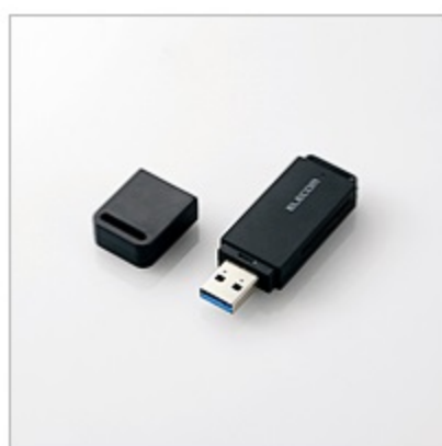
USB3.0対応メモリカードリーダー(スティックタイプ)