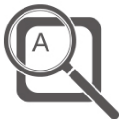
見やすいオリジナルフォント