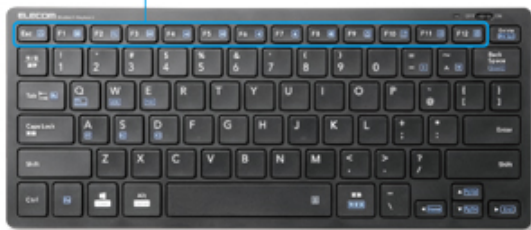
マルチファンクションキー搭載

Webブラウザやメディアプレーヤーの機能などを専用キーを押すだけで実行できる13種類のマルチファンクションキーを搭載しています。