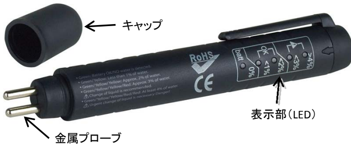
図1 テスターの構成図

注意: 使用の際には保護めがね、手袋などを装着してください。 プローブ以外は浸さないでください。