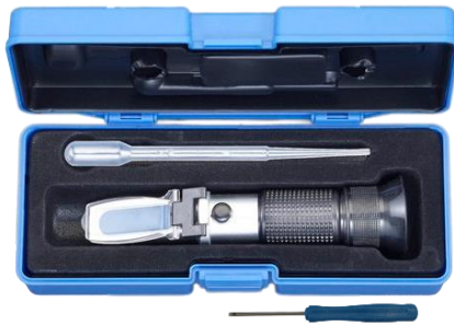
スポイト、調整ドライバー付属

このたびは当商品をお買い上げ頂き誠にありがとうございます。ご使用に際しましては取扱説明書をよくお読み頂きますようお願いいたします。