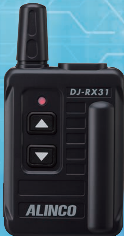
受信機はブラック

幅52.8mm×高さ73.8mm×薄さ14.6mm、乾電池を含んで約64gと 驚きの小型・軽量サイズ。(突起物・イヤホンやマイクは含まず)