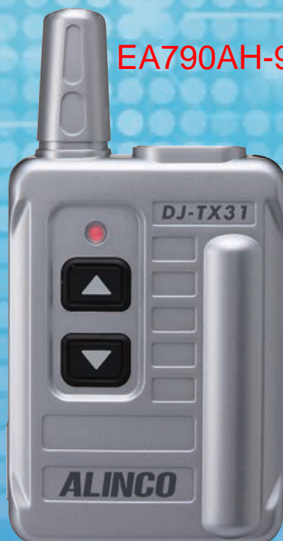
送信機はシルバー