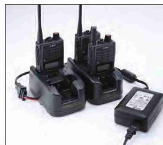
工具不要で最多4台のEDC-167RとEDC-162 ACアダプター1台を組み合わせ、8台同時に充電できるマルチチャージャーが作れます。