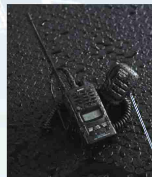
マイクユニットもIP67の耐塵防浸、別売スピーカーマイク、EMS-71