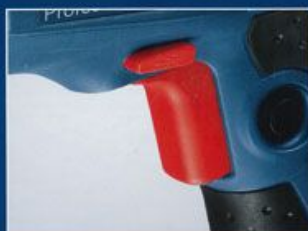
扱いやすい電子無段変速スイッチ