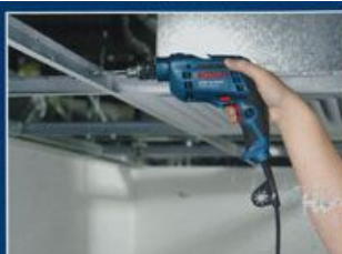
ソフトグリップ付きの新しい改良型コンパクトデザイン