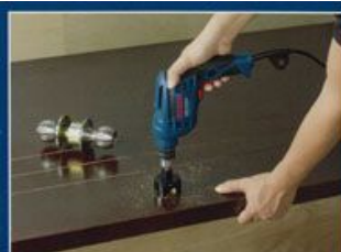
非常に快適に操作でき、長寿命です