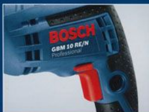
エルゴノミクスデザインされたソフトグリップ