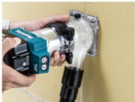
ボードの抜き加工