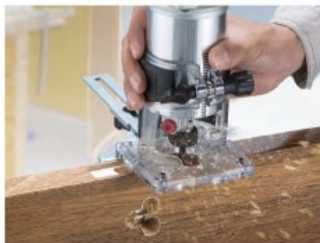
ドアノブ等の加工