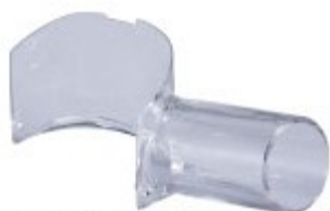
【標準付属】ダストノズル