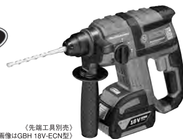
《先端工具別売》 《画像はGBH 18V-ECN型》