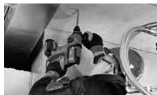
軽量ボディで上向き作業もラクラク!

*コンクリート設計圧縮強度: 24N/mm 2 ※これらのデータは材料の硬さ、気温、先端工具の状態等により多少異なります。