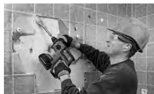
軽破りも可能です。