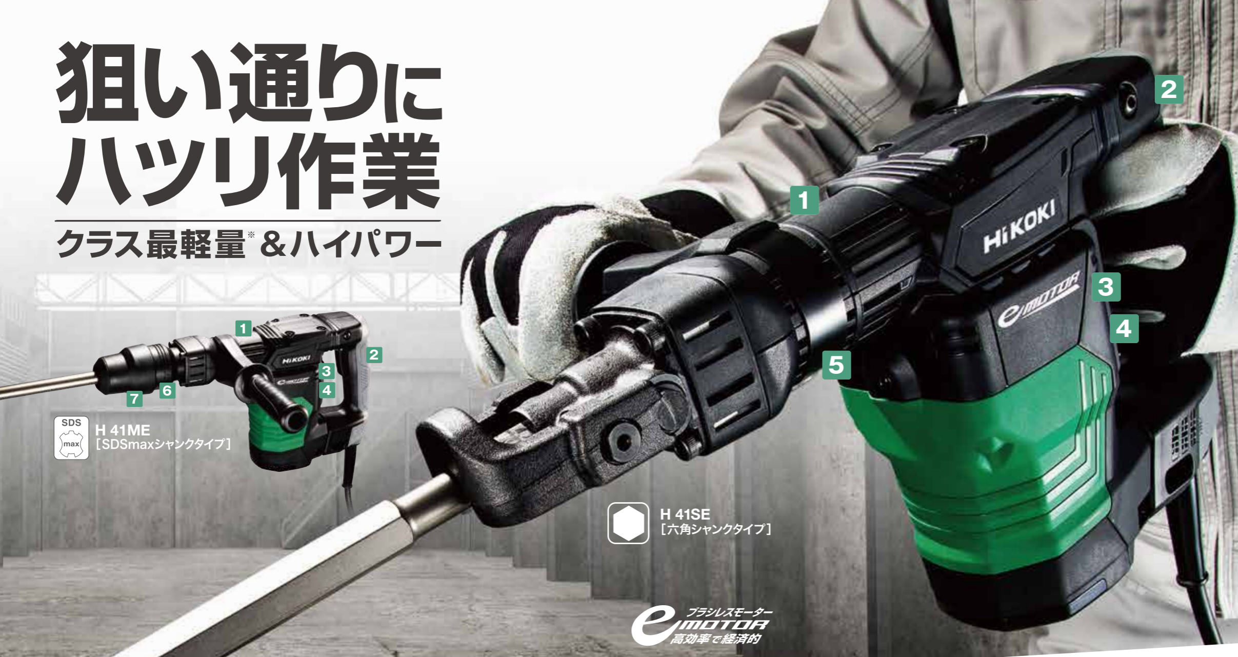
SDS max H 41ME 【SDSmaxシャンクタイプ】