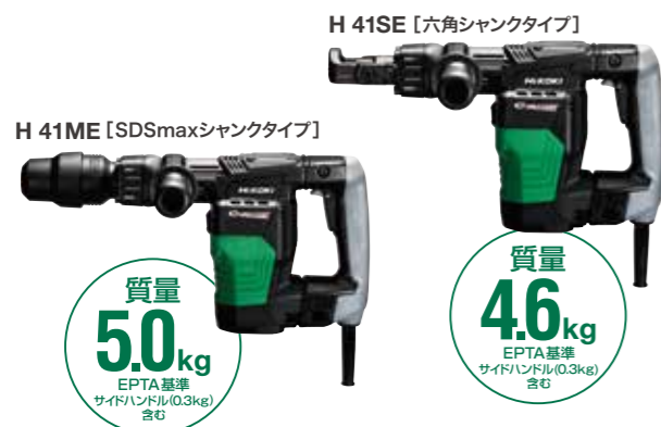
H 41SE 【六角シャンクタイプ】

ACブラシレスモーター搭載&徹底した部品の軽量化により取り回しが良く、長時間の 作業や横向き作業での負担を軽減します。