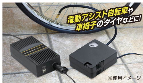
電動アシスト自転車や 車椅子のタイヤなどに!