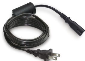
付属品: 電源コード ■ コード長 1.8m