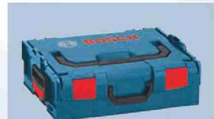
GDR 18V-ECN, GDR 14.4V-ECN型の キャリングケースはL-BOXX136が付属します。

http://www.facebook.com/BoschPowertoolsJp