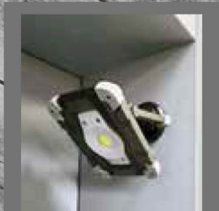
マグネットマウント装着時