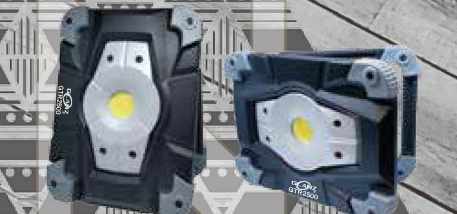
縦置き横置きで使える

GTR2500であればロープを渡して頂いてフックを利用してこれ一台でテント内全段を明るく照らせます。