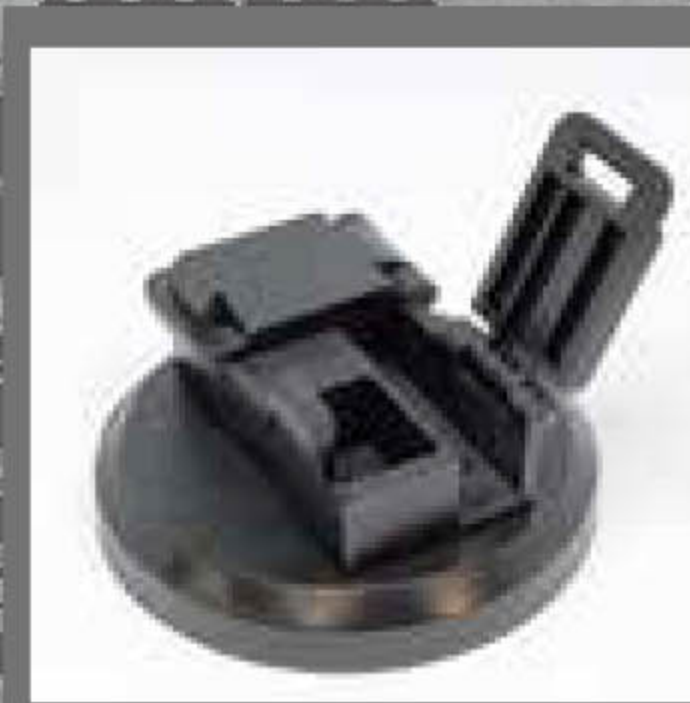
別売:マグネットマウント