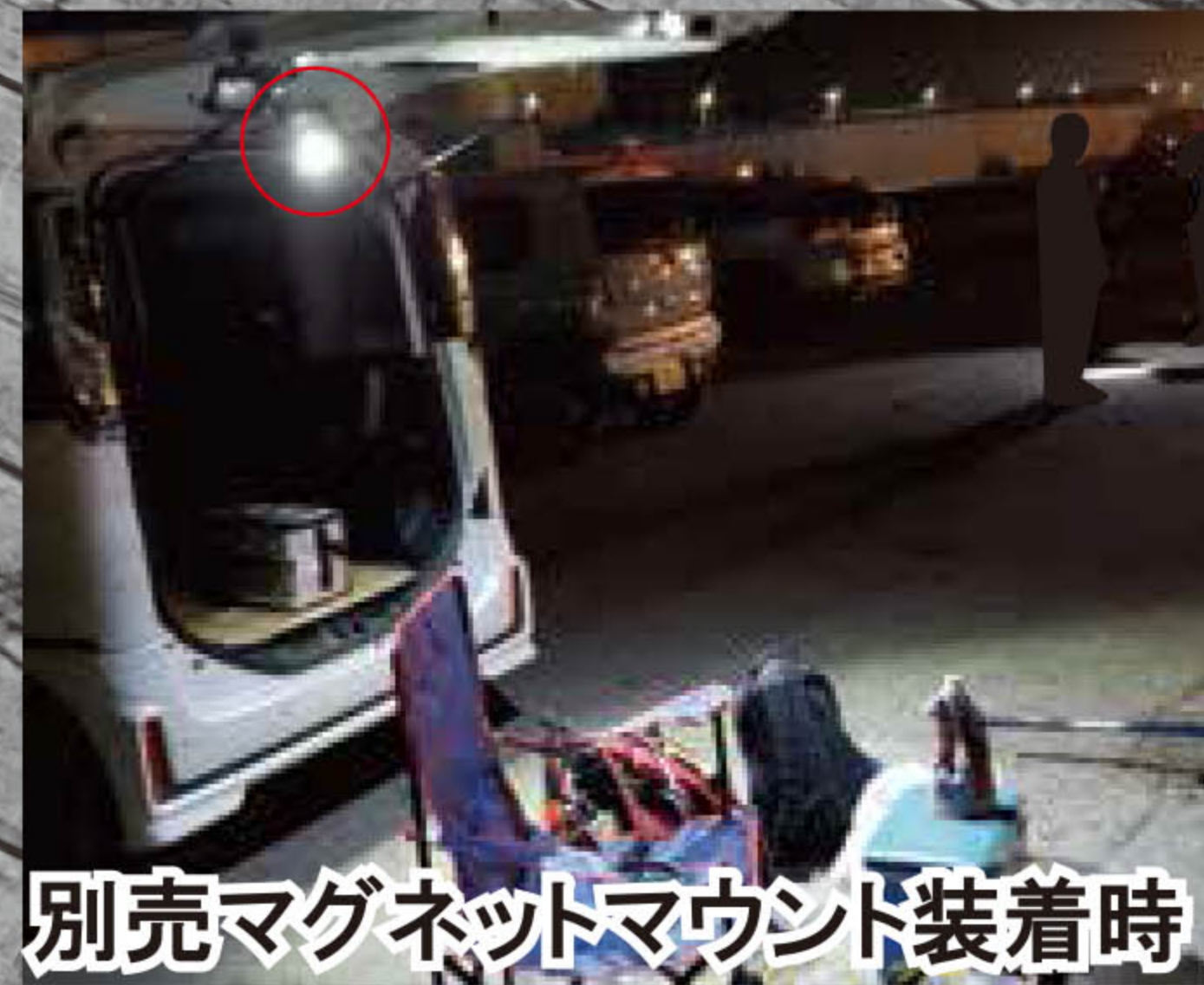
別売マグネットマウント装着時

便利なマイクロUSBチャージ 5V2A専用アダプタ付属 急速充電約3.5~4時間