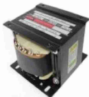
SD-164 (16V/4A type)