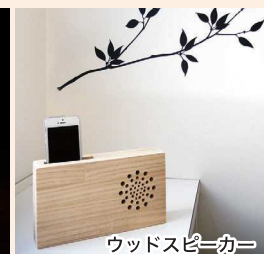
ウッズスピーカー