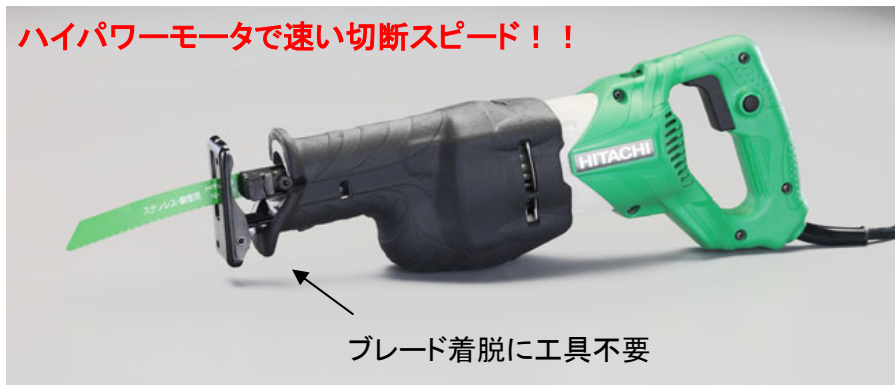
ブレード着脱に工具不要