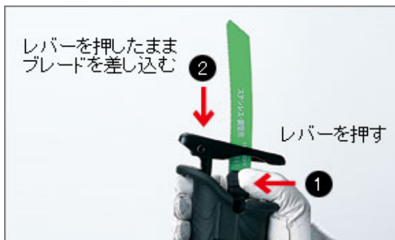
ブレード着脱ツールレス機構