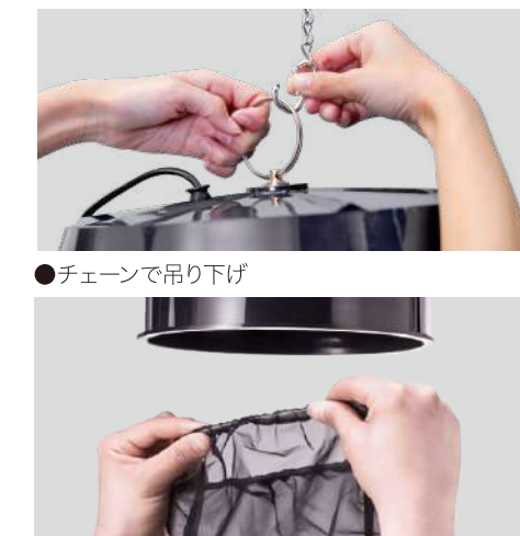
●チェーンで吊り下げ