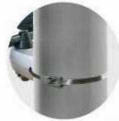
ステンレスバンド(SP-7)別売