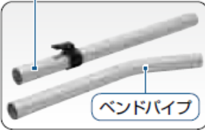
ストレートパイプ