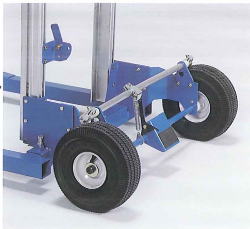
直径 25.4cmの空気入り後輪とフットペダルのブレーキ