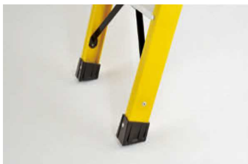
滑り止めキャップ部分