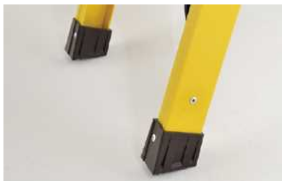
滑り止めキャップ部分