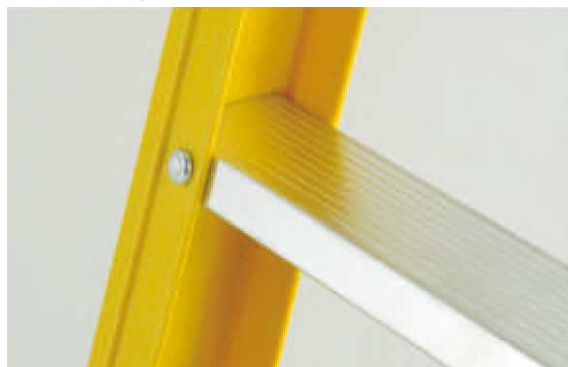
リベットジョイント構造