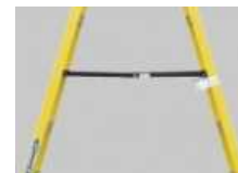
中折れ式 開き止め金具 FRP-SL18S～27S