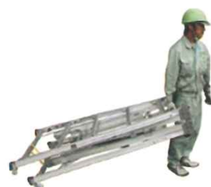
収納時、キャスターにて移動が可能