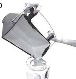
1.余分な塗料を取り除いてください。(図10)