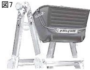
図7 7.コンテナは、EA905EC-150～EA905EC-330が脚立状態のとき、上部内側に取付けるように設計されています。(図7)