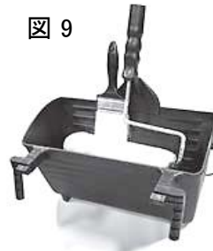
2.長辺の部分に取付けるときは、ブラケットはローラーとブラシの両方を保持できます。(図9) ローラーはブラケット自体に、ブラシはマグネットで保持します。 ブラケットは長辺と短辺の端にも取付けることができますが、ブラシのみの保持となります。