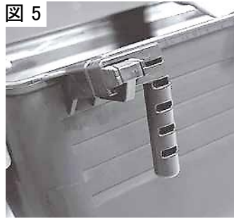
図 5 5.Bの支柱とアームも同じようにして取付けてください。(図5)