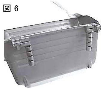
図 6 6.この状態で、EA905EC-150～EA905EC-330に接続し、使用できます。(図6)