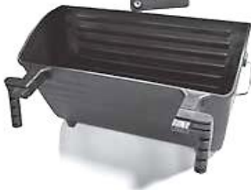
1.ブラケットは4つのどの面にも取付可能です。(図8)