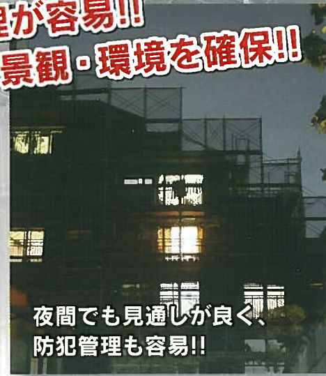
夜間でも見通しが良く、防犯管理も容易!!