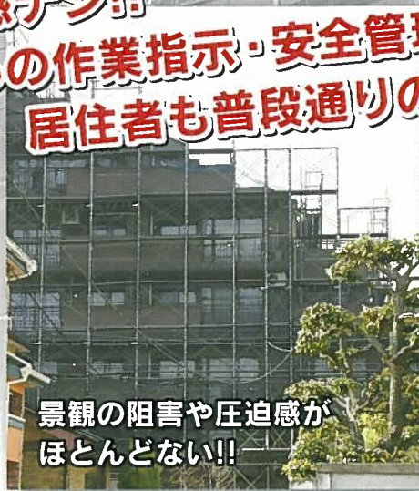
景観の障害や圧迫感がほとんどない!!