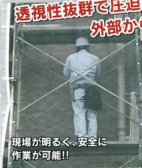
現場が明るく、安全に作業が可能!!

透視性抜群で圧迫感ナシ!! 外部からの作業指示・安全管理が容易!! 居住者も普段通りの景観・環境を確保!!