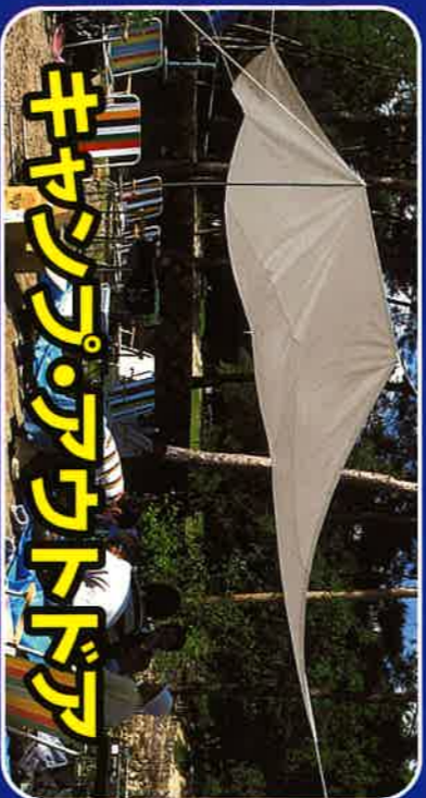
キャンピングアウトドア