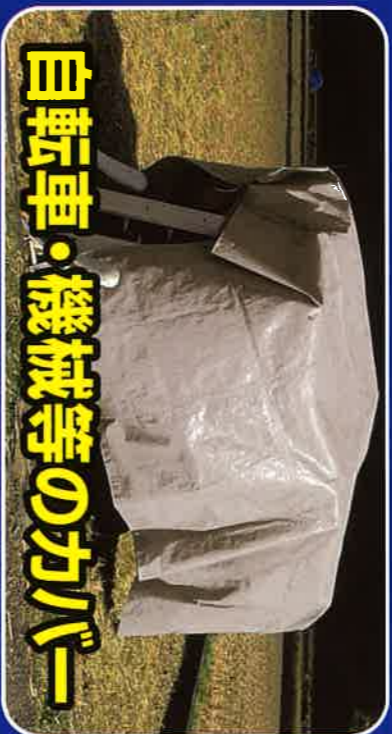
自転車・機械等のカバー