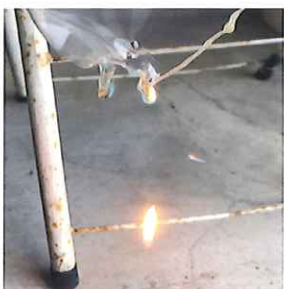
△ 通常製品 滴下している